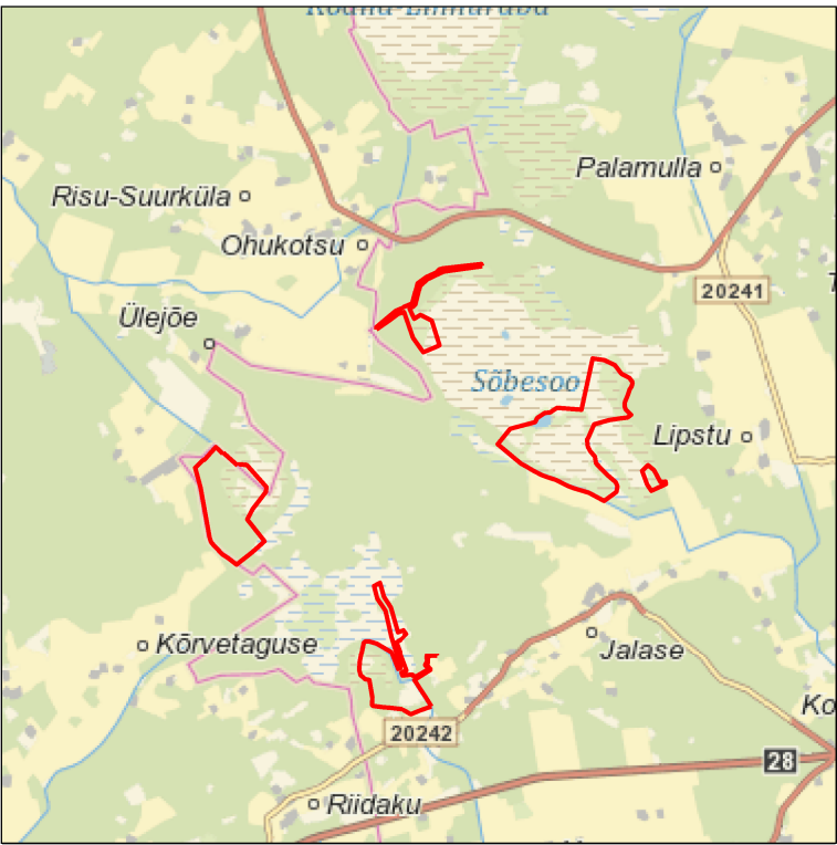
Kaardileht nr 631 Rapla